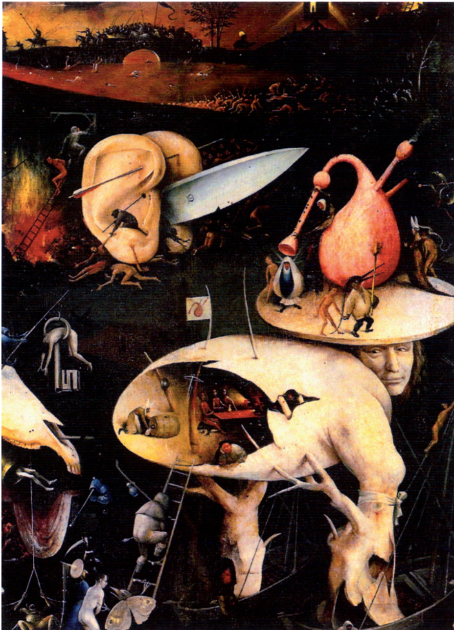
Triptyque du jardin des délices (détail du panneau droit), Jérôme Bosch, peinture sur bois, 220 x 195 cm, vers 1500, Musée du Prado, Madrid.