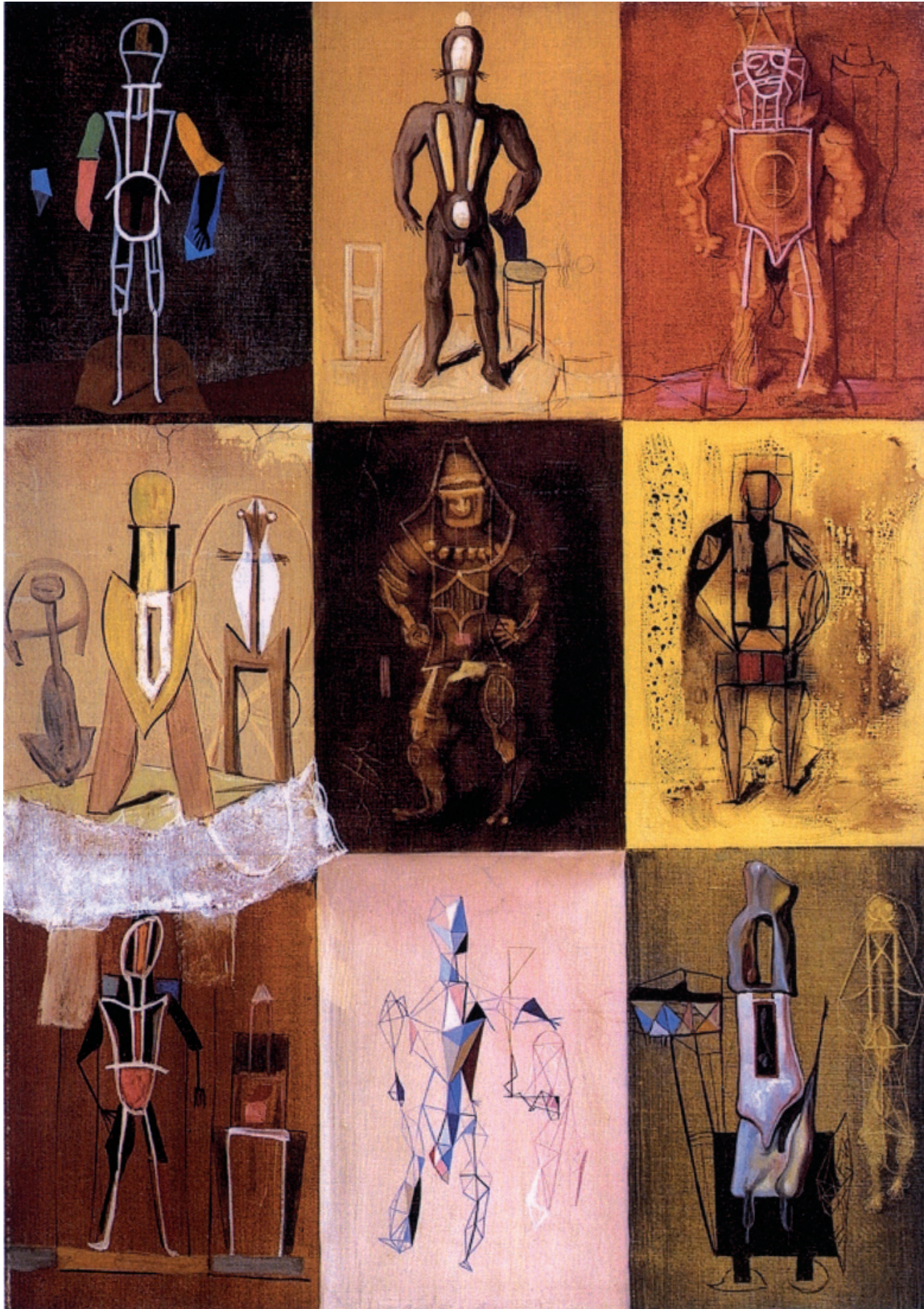
Petite Morphologie , Victor Brauner, 1934, huile sur toile, 64,5 x 45 cm, The Menil Collection, Houston Texas, in Les Années 30 - La Fabrique de «L'Homme nouveau» , catalogue de l'exposition au Musée des Beaux-Arts d'Ottawa, Canada, Éditions Gallimard, 2008, page 150.