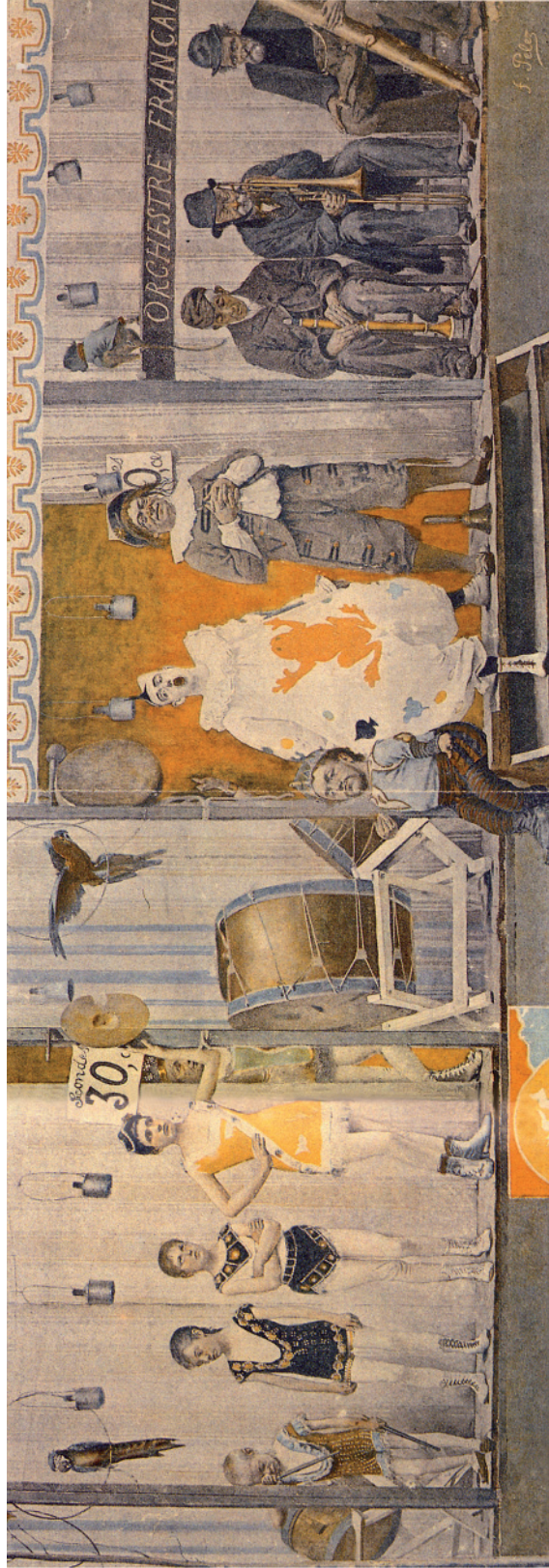
Grimaces et misères , vers 1880, Musée national des Arts et Traditions populaires, Paris, in Art forain , numéro spécial 76 de Connaissance des arts , 1995, page 60