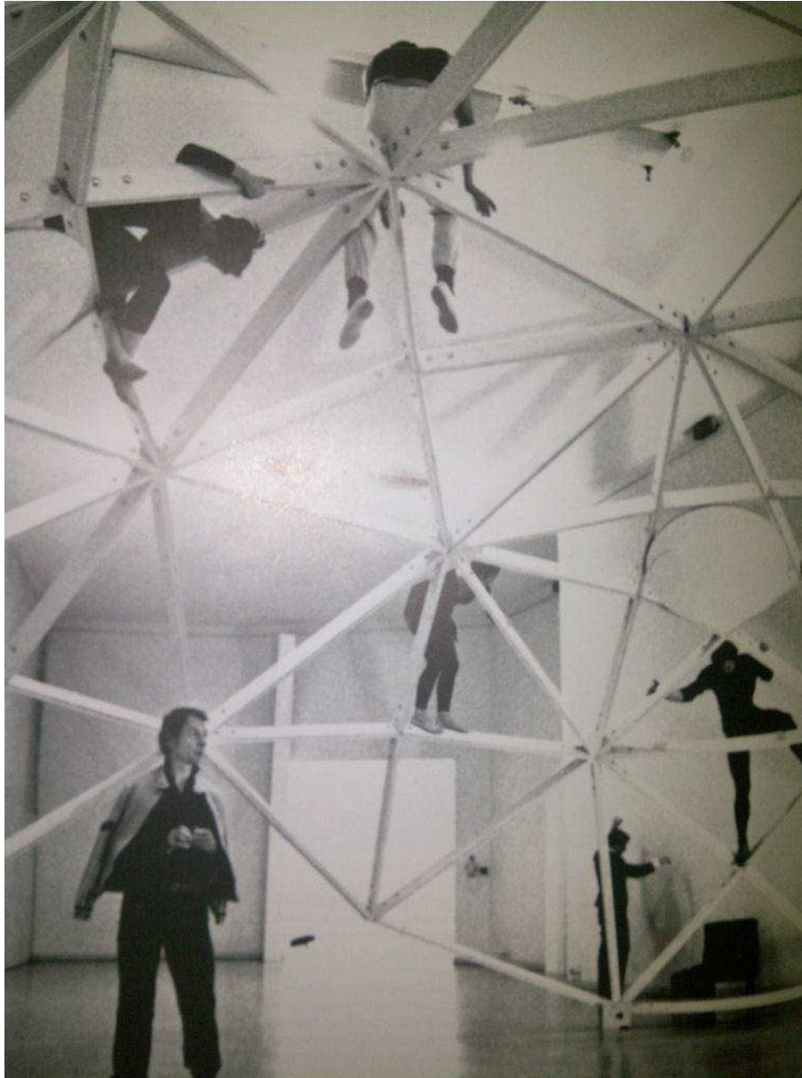
Event en répétition au Musée d'art moderne de la ville de Paris, 1970, Merce Cunningham