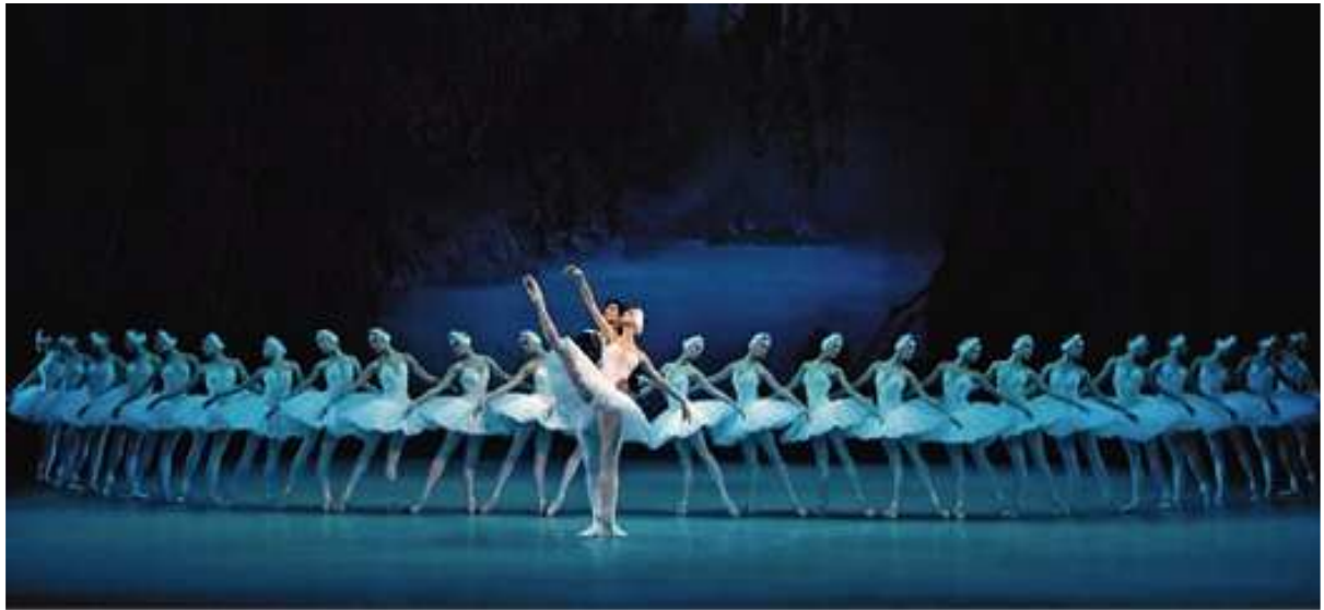
Le lac des cygnes, M. Petipa