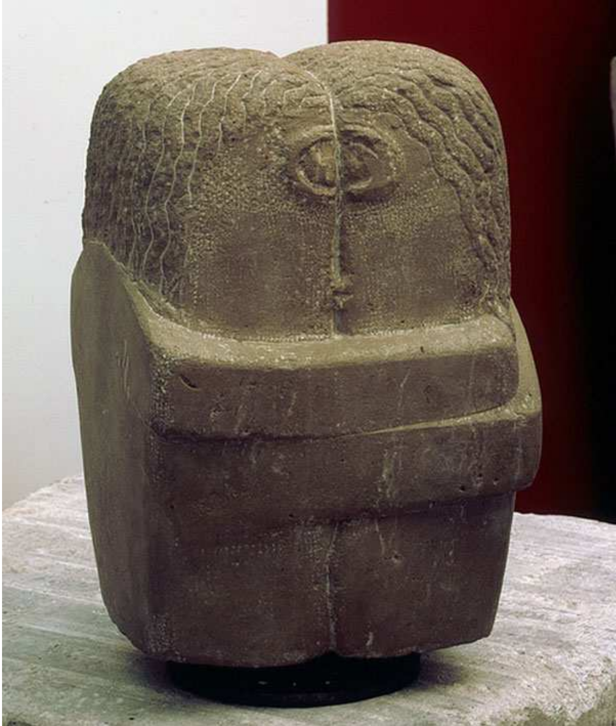
Constantin Brancusi, « Le Baiser », 1923-1925, pierre calcaire brune, 36,5 cm x 25,5 cm x 24 cm, Centre Pompidou