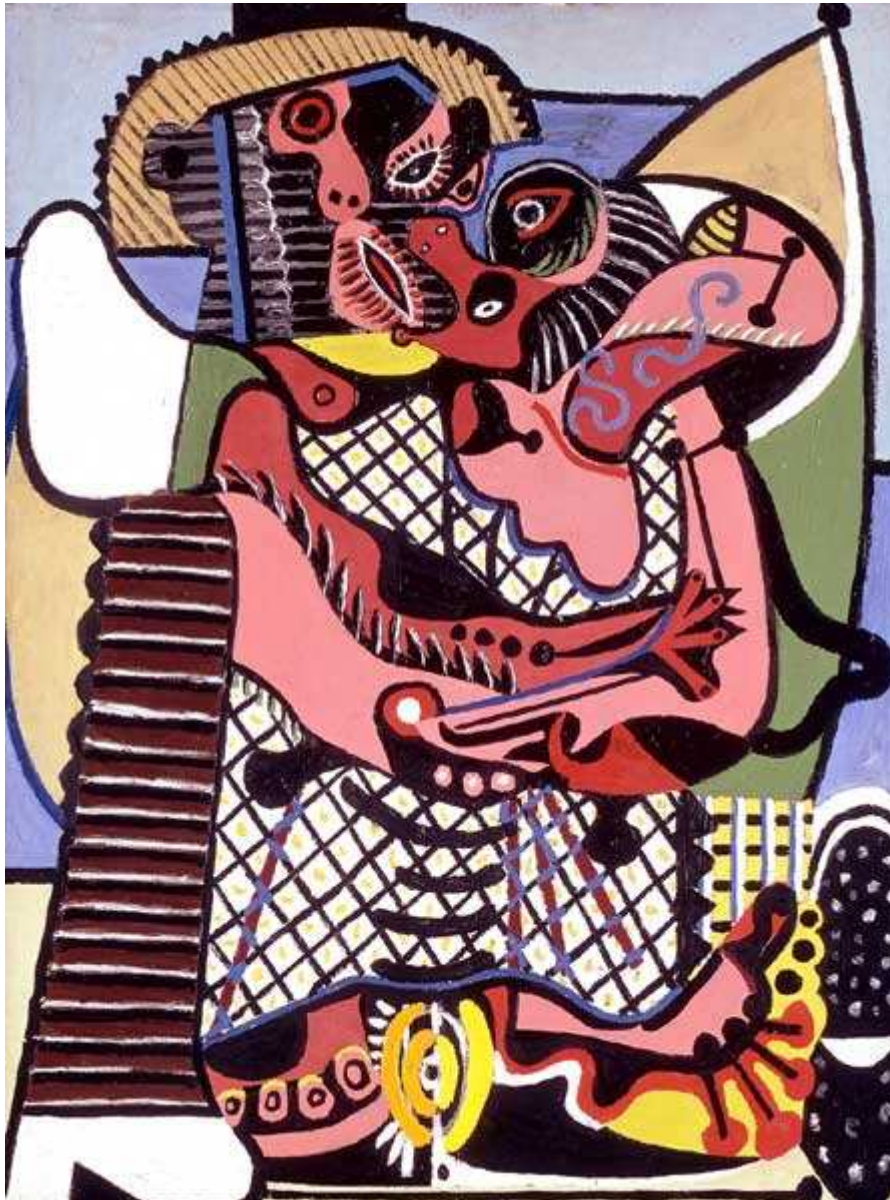
Pablo Picasso, « Le baiser », été 1925, huile sur toile 130 x 97,7 cm, Musée national Picasso