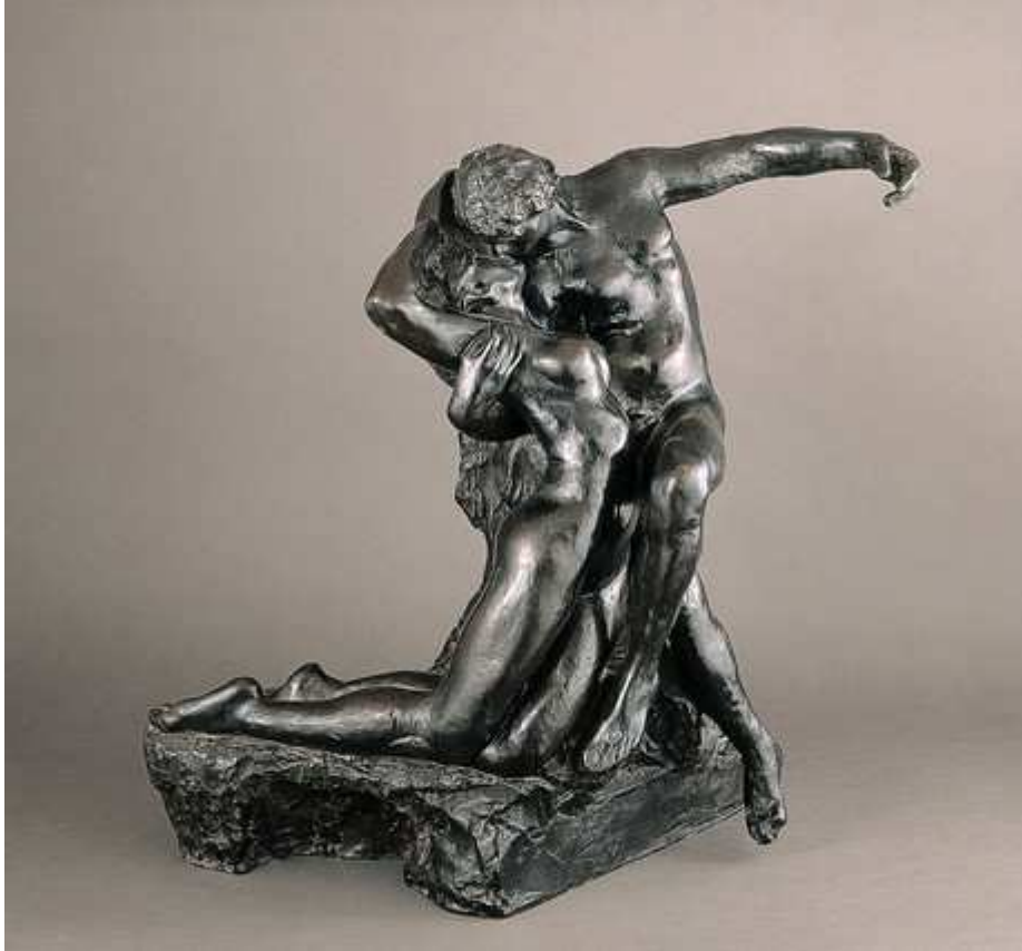
Auguste Rodin, « L'Eternel Printemps », vers 1884, bronze, 64,5 cm x 58 cm x 44,5 cm, Musée Rodin