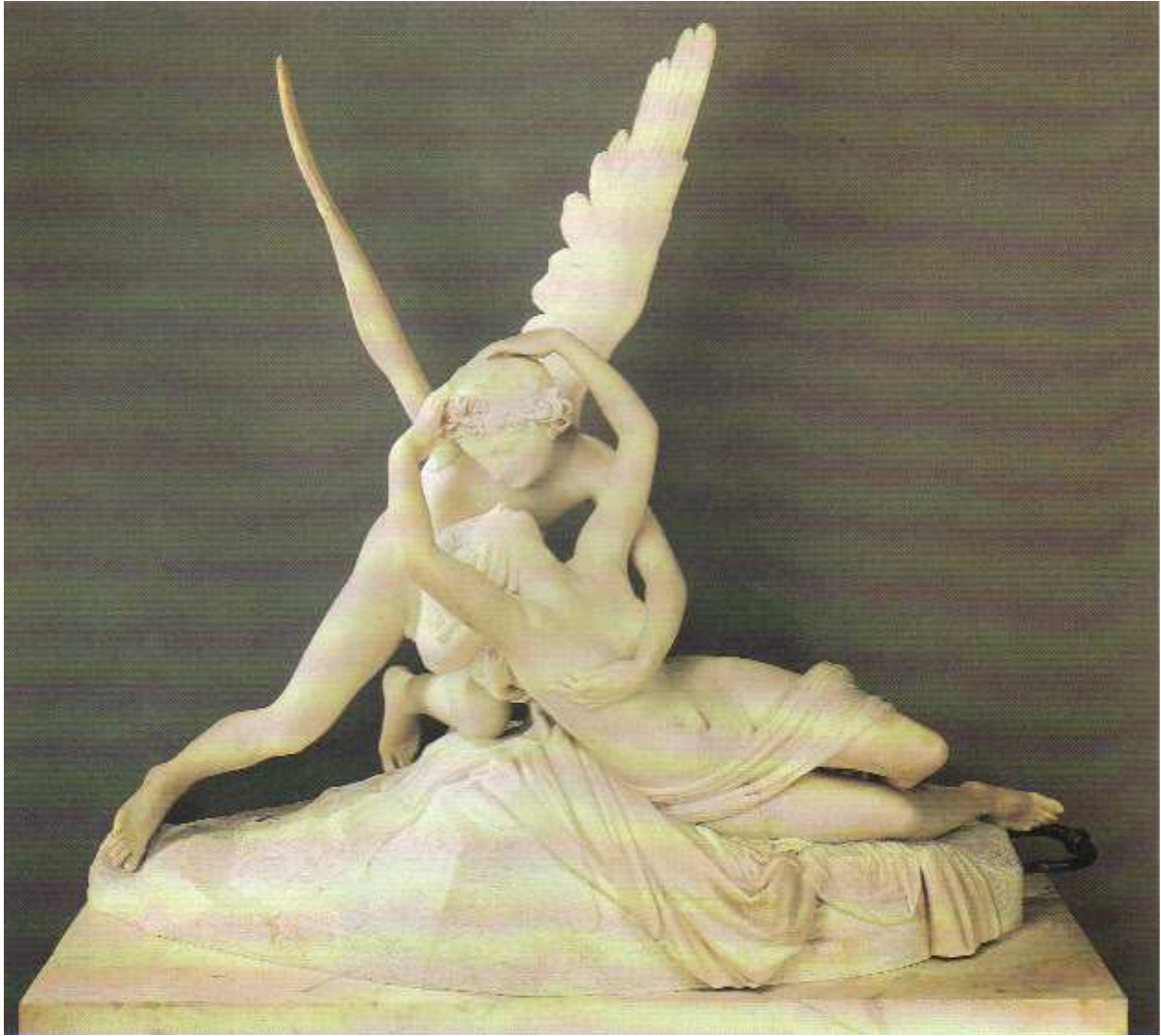
Antonio Canova, « Psyché et l'Amour » (Psyché ranimée par le baiser de l'Amour), 1793, Musée du Louvre