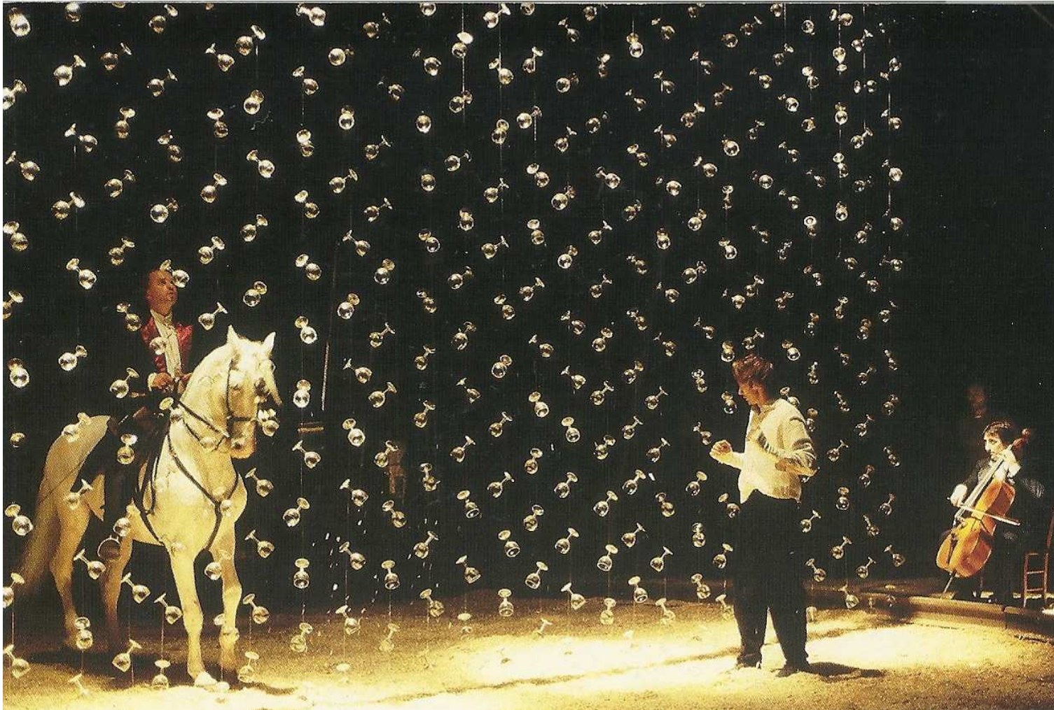
Compagnie Foraine, ReVu/ Rue Marcel Duchamp , 1997 (extrait de Théâtre Aujourd'hui n°7, p 33, photo C. Beauregard)