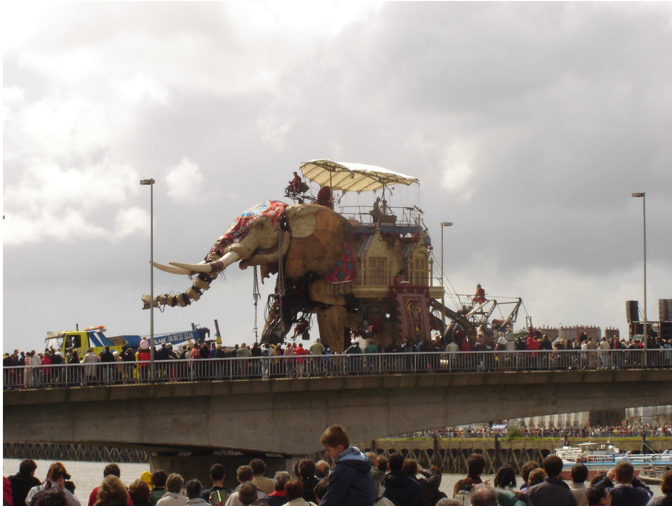
L'éléphant de Royal de Luxe, Nantes, mai 2005